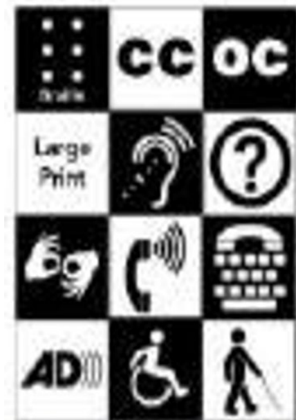
Disability Access Symbols